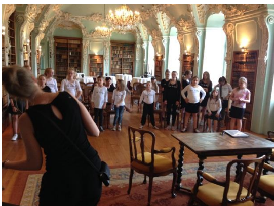
Het jeugdkoor oefent nog even in de bibliotheek

Op zondag 28 mei trad het jeugdkoor CantaYoung op in abdij Rolduc tijdens het slotconcert van CantaRode 2017.