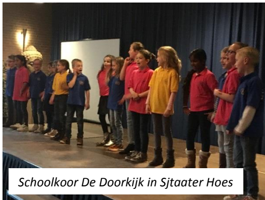
Schoolkoor De Doorkijk in Sjtater Hoes