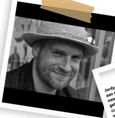
Groepen 1-2 drama JORDY

Mijn naam is Tessie Crombach. 56 lente jong. Ik heb Mode gestudeerd aan de Kunstacademie in Maastricht. Mijn richting was theatrale kleding en ik werk graag 3 dimensionaal. Vanaf mijn 9de levensjaar ben ik al bezig met hergebruik van materialen voor mijn creaties. Tijdens de schoolperiode van mijn eigen kinderen heb ik alle creatieve activiteiten op hun school vorm gegeven en wist ik dat daar mijn grootste passie lag. Sinds 2015 geef ik via diverse instanties workshops op basis- en middelbare scholen. Vanaf 2018 werk ik als creatief ZZP'er onder andere voor de Vazom. En dat doe ik met heel veel plezier. Ik verheug mij erop om samen met jullie mooie kunstzinnige creaties te maken en jullie te leren hoe je je eigen creativiteit kunt gebruiken.