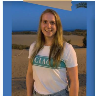
Groepen 1-2 dans CHIARA